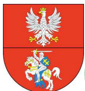
Przewodniczący Kapituły Konkursu Marszałek Województwa Podlaskiego