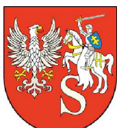
Przewodniczący Konwentu Powiatów Województwa Podlaskiego Starosta Siemiatycki