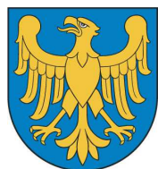
Przewodnicząca Kapituły Konkursu Marszałek Województwa Śląskiego