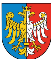
Przewodniczący Konwentu Powiatów Województwa Śląskiego, Starosta Bielski