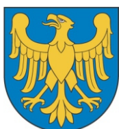
Przewodnicząca Kapituły Konkursu Marszałek Województwa Śląskiego