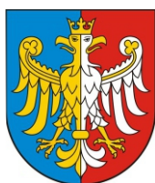
Przewodniczący Konwentu Powiatów Województwa Śląskiego, Starosta Bielski