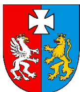
Przewodniczący Kapituły Konkursu Marszałek Województwa Podkarpackiego