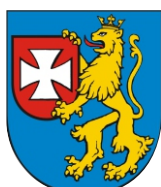
Przewodniczący Konwentu Powiatów Województwa Podkarpackiego Starosta Rzeszowski